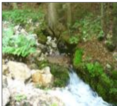
Izvir pod smreko- Javorniški Rovt