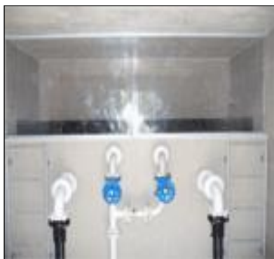
Vodohran Javorniški Rovt