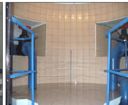
Vodohran Šporn - Jesenice