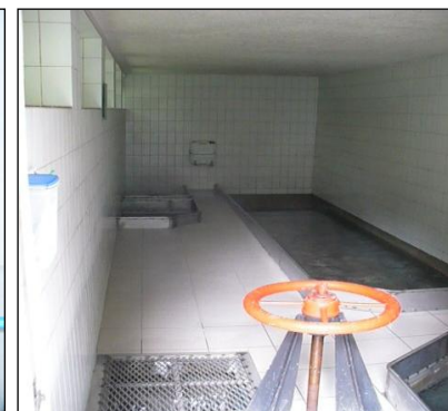
Zbirno zajetje Peričnik