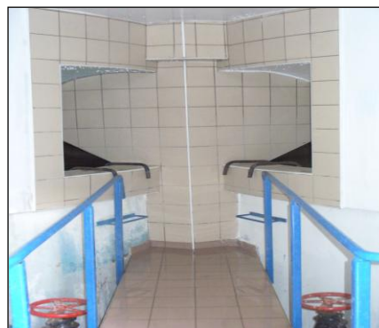
Vodohran Bolniški - Jesenice